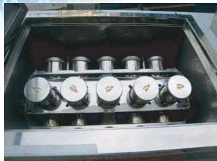
550c.c. 鋼杯 外徑7.64，內徑7.25，高13.0cm 杯蓋為螺牙式，杯身一體成型式 Outside diameter of 7.64， Inner diameter of 7.25，High 13.0cm Lid for Luo tooth type Cup forming one body style.