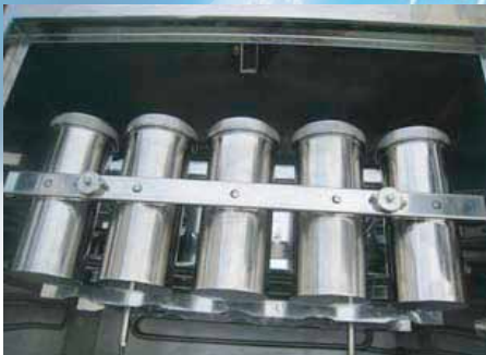
1150c.c. 鋼杯 外徑8.77，內徑8.45，高20.3cm 杯蓋為螺牙式 Outside diameter of 8.77， Inner diameter of 8.45，High 20.3cm Lid for Luo tooth type.